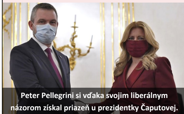
Peter Pellegrini si vďaka svojim liberálnym názorom získal priazeň u prezidentky Čaputovej.

Netreba si preto robiť veľké ilúzie. Východiskom zo súčasného marazmu nie sú tí, ktorí už raz národ do bahna zatiahli a vďaka ktorým sa tu k moci dostali psychopati a amatéri. Východiskom je jedine politika založená na hodnotách. Národných a kresťanských!