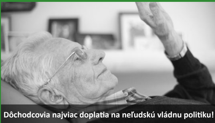
Dôchodcovia najviac doplatia na neľudskú vládnú politiku!

Za pochybné vakcíny, ktorými sa na Slovensku masovo očkuje, nenesie nikto zodpovednosť. Ani výrobca, ani vláda, ani Mikasov Úrad verejného zdravotníctva. To sa musí zmeniť!