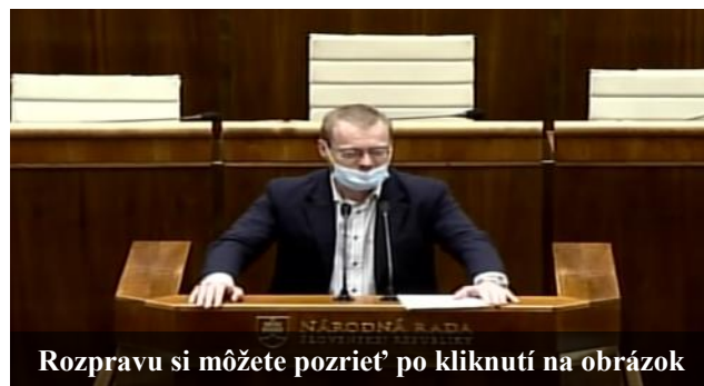
Rozpravu si môžete pozrieť po kliknutí na obrázok