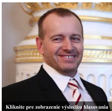
Kliknite pre zobrazenie výsledku hlasovania

Poslanci Borisa Kollára (Sme rodina) tri dni všetkým odkazovali, že zákon o očkovacom apartheidu nepodporia. Svoj postoj zverejnili dokonca na svojej facebookovej stránke. Na tretí deň však drvivá väčšina poslancov z klubu Sme rodina zákon podporila. Na zmenu názoru stačilo stretnutie Borisa Kollára s premiérom Eduardom Hegerom. Keď ide o vládne kšefty, charakter a sľuby idú bokom. Boris Kollár zradil dôveru ľudí. Za celé obdobie procesu schvaľovania zákona ani len raz nepredstúpil pred dav ľudí. Nakoniec po schválení zákona sadol do vládnej limuzíny a odišiel na dovolenku.