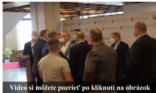
Video si môžete pozrieť po kliknutí na obrázok

Poslanci Borisa Kollára (Sme rodina) tri dni všetkým odkazovali, že zákon o očkovacom apartheidu nepodporia. Svoj postoj zverejnili dokonca na svojej facebookovej stránke. Na tretí deň však drvivá väčšina poslancov z klubu Sme rodina zákon podporila. Na zmenu názoru stačilo stretnutie Borisa Kollára s premiérom Eduardom Hegerom. Keď ide o vládne kšefty, charakter a sľuby idú bokom. Boris Kollár zradil dôveru ľudí. Za celé obdobie procesu schvaľovania zákona ani len raz nepredstúpil pred dav ľudí. Nakoniec po schválení zákona sadol do vládnej limuzíny a odišiel na dovolenku.