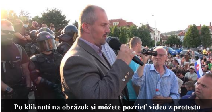
Po kliknutí na obrázok si môžete pozrieť video z protestu

Podpora protestujúcimi občanmi sme sa v pléne Národnej rady SR snažili argumentačne presvedčiť čo najviac vládnych poslancov, aby za tento