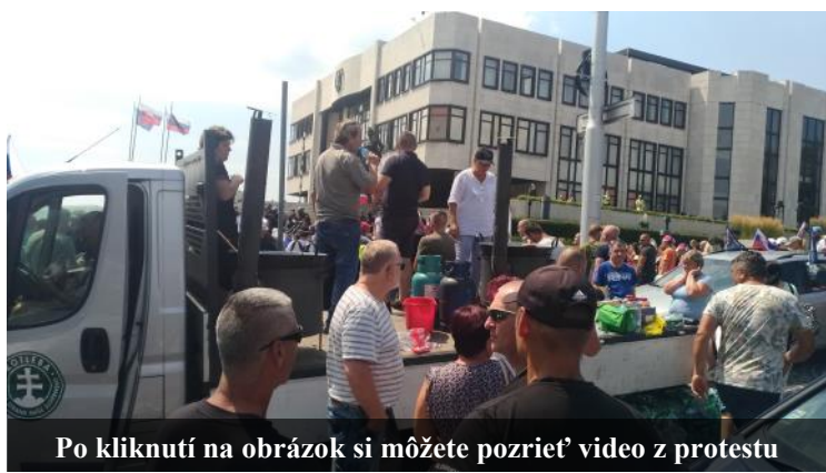
Po kliknutí na obrázok si môžete pozrieť video z protestu

Presne na to sa spoliehala vláda, keď chcela v čo najväčšej tichosti presadiť fašistický, segregáčny zákon očkovacieho apartheidu. Vláda dokonca v snahe znemožniť zmobilizovať sa čo najväčšiemu počtu ľudí zverejnila program schôdze len pár dní pred samotným konaním schôdze.