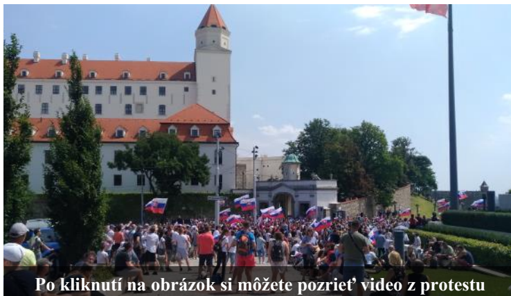
Po kliknutí na obrázok si môžete pozrieť video z protestu

fašistický zákon nezahlasovali. Protestujúcim sme vždy prinášali aktuálne informácie z diania v Národnej rade. Kým naši poslanci nemali problém prísť medzi ľudí a pozrieť sa im do očí, vládni poslanci sa schovávali a presúvali parlamentným tunelom ako potkany. Niet sa čomu čudovať. Ľudí protestujúcich pred parlamentom nazývali spodinou, dezolátmi či cirkusantmi. Nakoniec ich aj o slobodu pripravili, a to vďaka strane Borisa Kollára. Oficiálne tak začína doba totality a fašistickej segregácie.