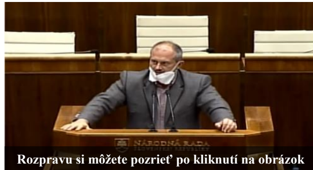
Rozpravu si môžete pozrieť po kliknutí na obrázok

Marian Kotleba sa v rozprave k segregačnému zákonu, ktorý má brutálne znevýhodniť neočkovaných, zastal štátnych príslušníkov policajného zboru, vojakov, zboru väzenskej a justičnej stráže, ale aj hasičov. Vláda vydiera štátnych príslušníkov tým, že ak sa nedajú zaočkovať, stratia rôzne výhody. Vojaci sa nebudú môcť zúčastniť zahraničných misií, policajti a hasiči stratia príplatky a mnohé ďalšie. Niektorí si môžu dokonca sťažiť odchod do výsluhového dôchodku.