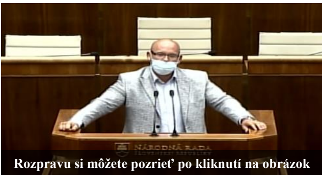
Rozpravu si môžete pozrieť po kliknutí na obrázok

Podpredseda Marek Kotleba všetkým poslancom v pléne pripomenul, že o vakcíne na COVID-19 nemáme žiadne dáta a o vedľajších účinkoch tak nevieme vôbec nič. Je pritom smiešne, že viacerí odborníci, ktorí očkovanie odporúčajú, sami nevedia odpovedať, aké dlhodobé vedľajšie účinky vakcína prinesie, prípadne priznávajú nežiadúce vedľajšie účinky napr. v podobe neplodnosti. Marek Kotleba veľmi šikovne poukázal aj na to, že PCR a antigénové testy vôbec neslúžia na diagnostikovanie zdravotného stavu.