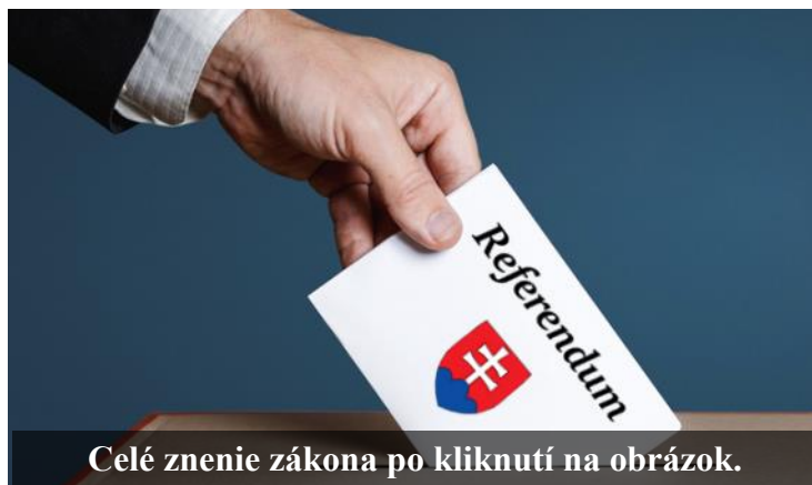
Celé znenie zákona po kliknutí na obrázok.

Preto sme do Národnej rady SR predložili návrh zákona, ktorý by zrušil potrebné 50% kvórum a tiež znížil potrebný počet podpisov na vyhlásenie referenda z 350 000 na 100 000. Návrh zákona mal zvýšiť mieru demokracie na Slovensku