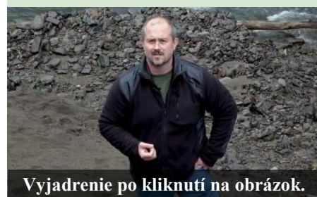
Vyjadrenie po kliknutí na obrázok.

Obyvateľov Rudna nad Hronom medzi prvými navštívil aj predseda ĽS Naše Slovensko Marian Kotleba, ktorý sa osobne zúčastnil humanitárnej pomoci. Vyjadrenie Mariana Kotlebu k celej situácii si môžete pozrieť po kliknutí na obrázok.