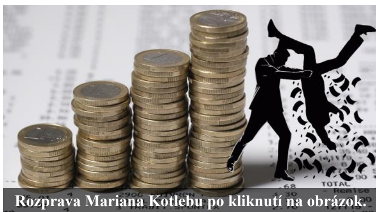
Rozprava Mariana Kotlebu po kliknutí na obrázok.

Na navýšenie štátneho dlhu zareagoval aj náš predseda Marian Kotleba, ktorý vystúpil v rozprave, aby celému Slovensku zdôraznil, na aké položky sa v budúcnosti budú musieť občania poskladať. Celú rozpravu Mariana Kotlebu si môžete pozrieť po kliknutí na obrázok.