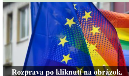
Rozprava po kliknutí na obrázok.

Proti týmto zámerom v pléne Národnej rady SR vystúpil predseda ĽS Naše Slovensko Marian Kotleba. Jeho rozpravu si môžete pozrieť po kliknutí na obrázok.