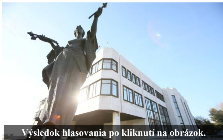
Výsledok hlasovania po kliknutí na obrázok.

Výsledok hlasovania si môžete pozrieť po kliknutí na dolný obrázok. Celý návrh zákona a dôvodovú správu si môžete prečítať po kliknutí na horný obrázok.