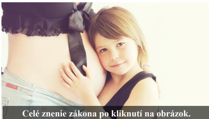
Celé znenie zákona po kliknutí na obrázok.

Aby sme sa postavili súčasnej kultúre smrti a zabránili úmyselnému zabíjaniu nenarodených detí, do Národnej rady SR sme predložili proti-potratový zákon, ktorý by umožňoval potraty len v niektorých