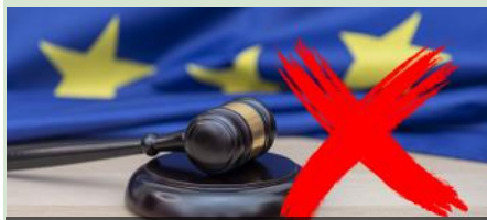
Článok po kliknutí na obrázok.

My tieto postupné kroky vedúce k zničeniu Slovenska odmietame. Celý článok k tejto téme si môžete prečítať po kliknutí na obrázok.