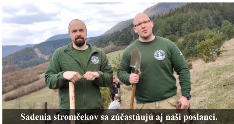
Sadenia stromčekov sa zúčastňujú aj naši poslanci.

Ľudová strana Naše Slovensko organizuje čistenie prírody celoplošne na celom Slovensku už od roku 2016.