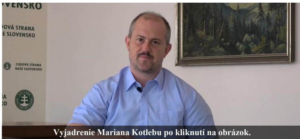
Vyjadrenie Mariana Kotlebu po kliknutí na obrázok.

Rozhodli sme sa preto, že v budúcnosti budeme za návrhy zákonov hlasovať vždy ZA alebo PROTI. Celé vyjadrenie nášho predsedu Mariana Kotlebu k danej problematike si môžete vypočuť po kliknutí na obrázok.