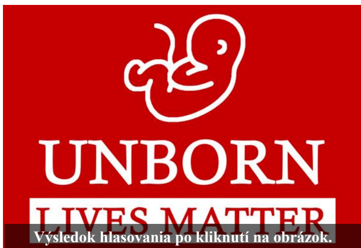
Výsledok hlasovania po kliknutí na obrázok.

Hlasovanie o návrhu zákona ako o celku sa neuskutočnilo, pretože liberálka a najväčšia obhajkyňa vraždenia nenarodených detí na Slovensku Jana Bitto Cigániková zneužila svoje postavenie spravodajkyne a navrhla hlasovanie o tom, aby sa nepokračovalo v rokovaní. Navyše spôsob, ako sa poslankyňa Cigániková stala spravodajkyňou bolo na hrane zneužitia právomoci verejného činiteľa, keďže za ňu nezahlasoval výbor, ale sa určila sama .