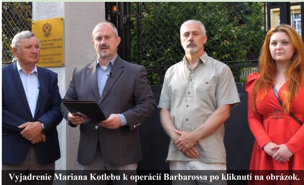
Vyjadrenie Mariana Kotlebu k operácii Barbarossa po kliknutí na obrázok.

Vyjadrenie nášho predsedu Mariana Kotlebu k danej téme si môžete vypočuť po kliknutí na obrázok.