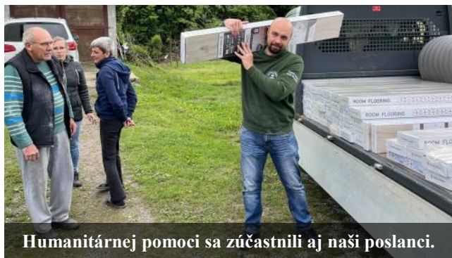
Humanitárnej pomoci sa zúčastnili aj naši poslanci.

Kým ostatné politické strany a ich predstavitelia sa zmohli len na slaboduché vyjadrenia, my sme opäť reálne pomohli. Znova ako jediní. Naša činnosť je viac než politická. Keby sme nevedeli, alebo nechceli pomôcť, naša politická práca by nemala žiaden zmysel.